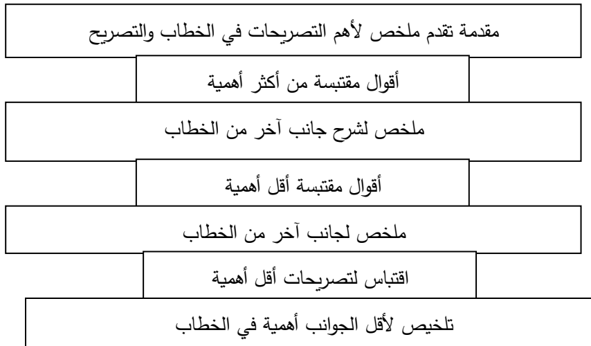
شكل (3) يوضح قالب الهرم المقلوب المتدرج

يكون هذا القالب أكثر ملائمة لصياغة الأخبار عن الأحاديث السياسية و الخطب والمؤتمرات والتصريحات وغيرها من المواد ويكون على الشكل التالي: